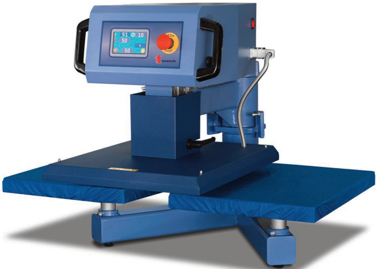
Heat Seal Revolution